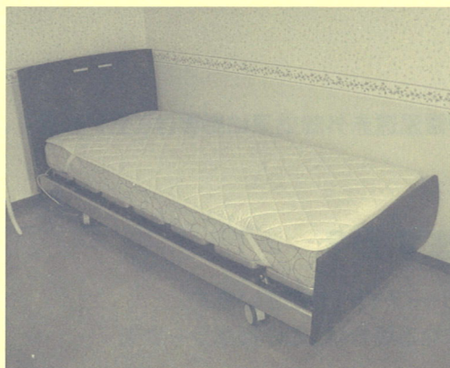
1. ディプスリーを敷き、バンドを掛ける。 (綿生地が上、メッシュ面が下)